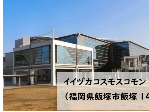
イヅカコスモスコモン 中ホール (福岡県飯塚市飯塚 14 番 66 号)